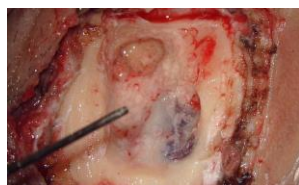
搏动性耳鸣的外科治疗